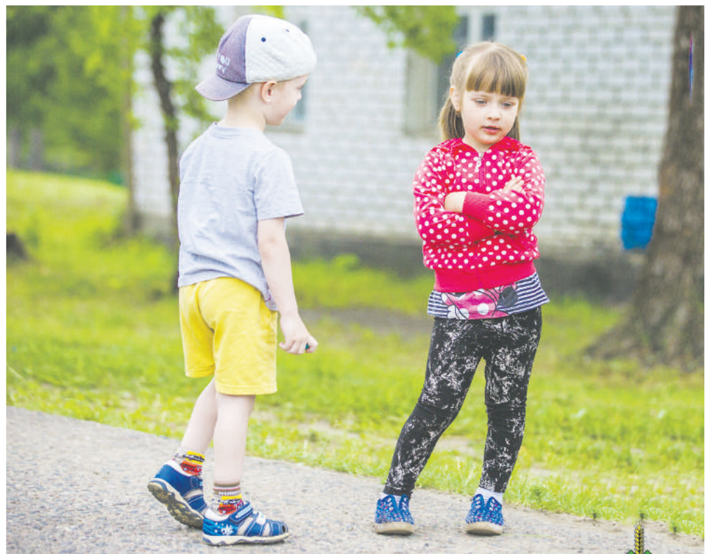
«Ну, не знаю, не знаю...» (деревня Клетиче, Столбцовский район)