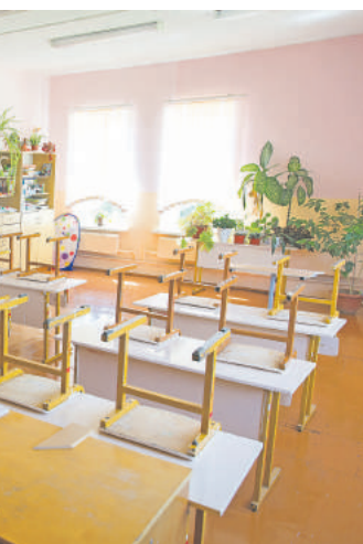
Школьные парты ждут не дождутся своих хозяев